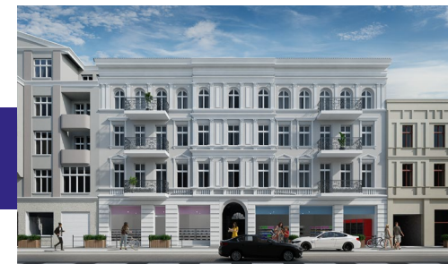
Widok budynku od strony ulicy

Inwestycja o niepowtarzalnym charakterze z ciekawą historią.